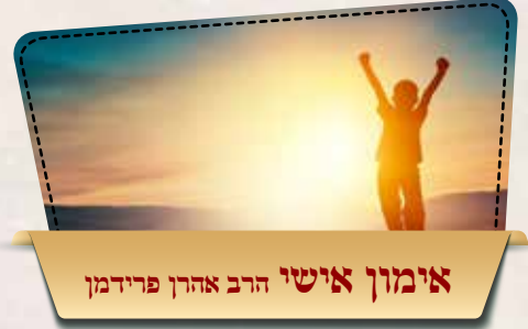
אימון אישי הרב אהרן פרידמן

יא. אסור לצחצח כלי כסף וכלי נחושת בשבת, ולא רק במטלית רגילה הטבולה בתכשיר נוזל אסור, אלא גם הצחצוח במטלית המיוחדת לכך שבה מצחצחים בלי כל נוזל-אין להתיר, שהרי עצם הצחצוח אסור הוא, אבל מותר לנגב יפה כלי זכוכית, גם אם משפשפו במגבת עד שיבריק.