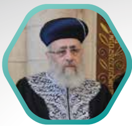
מרן הרשל"צ הרב יצחק יוסף שליט"א בכל מוצאי שבת בשעה 21:30

בורא עולם זן ומפרנס לכל היצורים בעולם כולל אותך! ישנם רבים