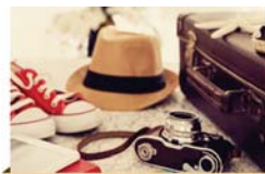
רגע חושבים עמוד 4

ועוד מעשה היה בדוד המלך ע"ה, שברח לאכיש מלך גת, לא ידע מי הוא, באו הפלשתים ואמרו לאכיש הרי דוד שהרג את אחיק גליית מסתתר אצלך! אשתו של אכיש ובתו היו משוגעים, מה עשה דוד המלך? התחיל להשתטות, וכתב על דלתות הבית דברי שטות ושגעון, הוציא רוק מפיו כדרך המשוגעים וצעק. ראה זאת אכיש אמר להם זה לא דוד, דוד הוא אדם חכם. מיד אמר דוד שירה, לדוד בשנותו וכל טעמו לפני אבימלך ויגרשה וילך אברכה את ה' בכל עת תמיד תהלתי בפיו! בכל עשה ה' את שליחותו, כל אלה היו שליחים להציל את