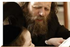
פרשת השבוע עמוד 3