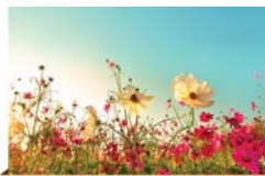
פינת ההלכה עמוד 3