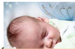
סיפור לשבת עמוד 2