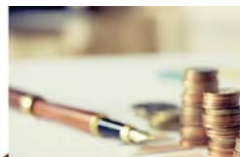
סיפור לשבת 2 עמוד