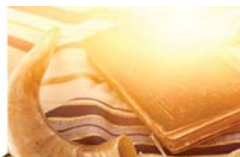
פינת ההלכה 3 עמוד