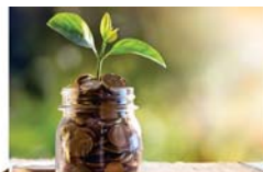
פרשת השבוע 3 עמוד