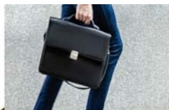
רגע חושבים 4 עמוד

ולמה? כי אמנם מצוות צדקה גדולה מאד, אבל צריך קודם כל שיהיה בסיס של היהדות, והשבת קודש זה הבסיס, אמנם צדקה מצילה מיסורים אבל רק אם