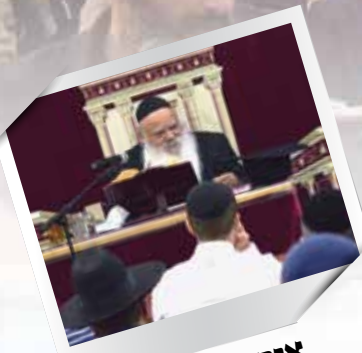
אור החיים הקדוש פירוש אור החיים על התורה בכל מוצ"ש בשעה 22:00