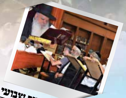
שיעור שבוועי מוסר | יהדות | הלכה בכל יום שני בשעה 20:00

בכל יום רביעי בשעה 22:00 רחוב במכבים 108 בני ברק ניתן לצפות באתר הישיבה Rabenu.com ובערוצי הלווין