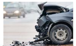
סיפור לשבת 2 עמוד