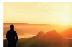
פרשת השבוע 3 עמוד