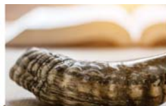
רגע חושבים 4 עמוד