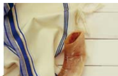
פינת ההלכה 3 עמוד