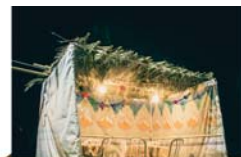
סיפורים מהחיים 2 עמוד