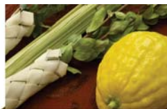
הלכות חג הסוכות 3 עמוד