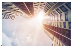
רגע חושבים 4 עמוד

כמו שאומרים חז"ל במדרש ששני אנשים יוצאים מבית משפט, איך יודעים מי יצא זכאי, אחד יוצא עם דגל ביד והשני עם הפנים ברצפה, אנו יודעים שזה שיצא עם הדגל ביד הוא המנצח. אנחנו יוצאים מיום כיפור עם ארבעת המינים בידיים וצועקים: נצחנו! אנחנו בעל הבית על האיברים שלנו. דעו לכם, אדם בא לדרשות מוסר, לשיעור