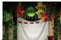
פרשת השבוע 3 עמוד