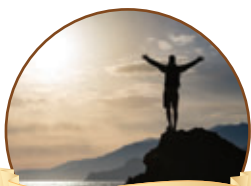
רגע חושבים עמ' 4

אומרים חסידים: בראשית ברא - אלוקים, על ידי שתבונן בבריאה תגיע לאמונה באלוקים! מדענים כנים עם עצמם, התבוננו בבריאה וגילו את הקב"ה, כמו שהבאנו מכבר ציטוטים מדברי מדענים גדולים שאמרו: כאשר חוקרים אנו את התבל ומתפללים למראה הודה והסדר הקבוע בה, אנו באים להכרה בכח עליון, העולה על כל אשר ישיג שכלנו המוגבל. האמונה בבורא עליון הכרחית! ולפי חוקי ההסתברות לא קיימת אפשרות שיזדמנו כל הגורמים יחד במקרה ליצור עולם,