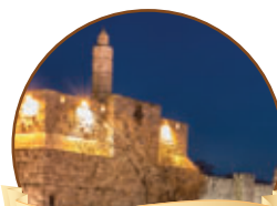
פינת ההלכה עמ' 3