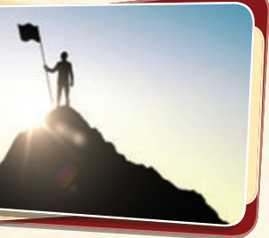
הרב משה דיין