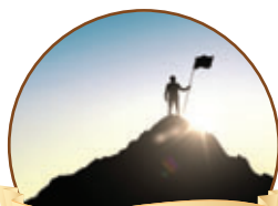
פרשת השבוע עמ' 3