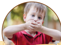
פרשת השבוע עמ' 3