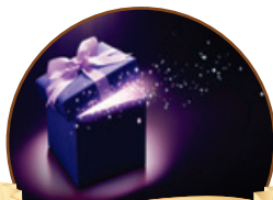
רגע חושבים עמ' 4

מתוך דרשתו השבועית של הרה"ג דניאל זר שליט"א המתקיימת בכל יום רביעי בשעה 22:00 בישיבת אור דוד