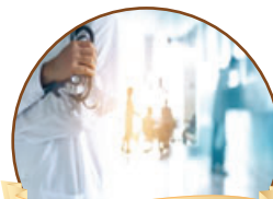
סיפור לשבת עמ' 2