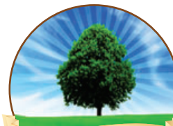
פינת ההלכה עמ' 3